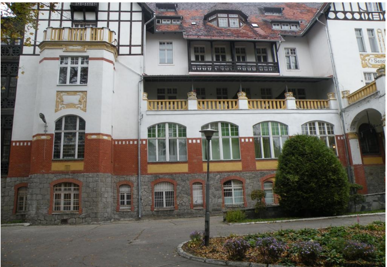
Fot. Nr 8 Fragment elewacji frontowej (wschodnia)