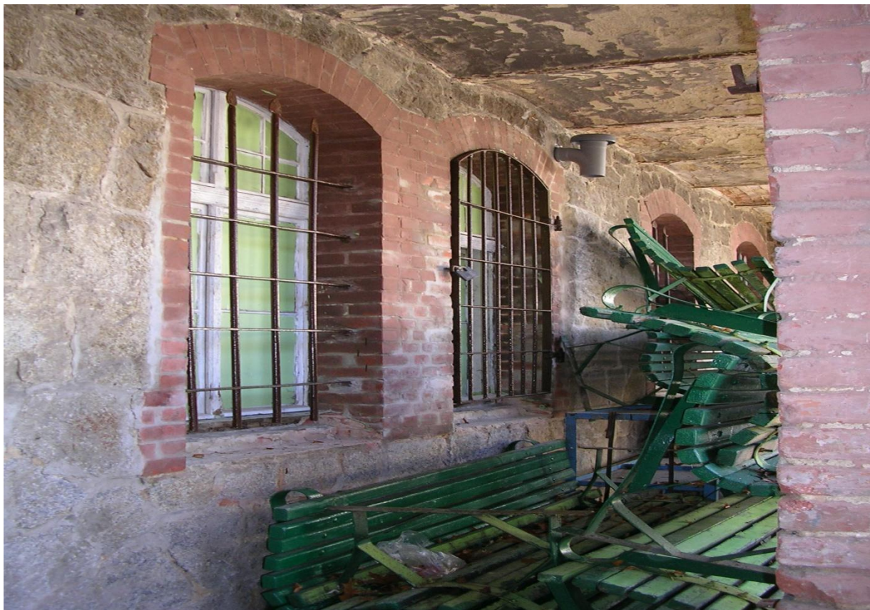
Fot. Nr 4 Fragment podcieni od strony elewacji północnej