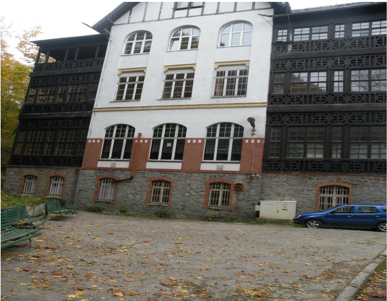
Fot. Nr 3 Fragment elewacji południowej