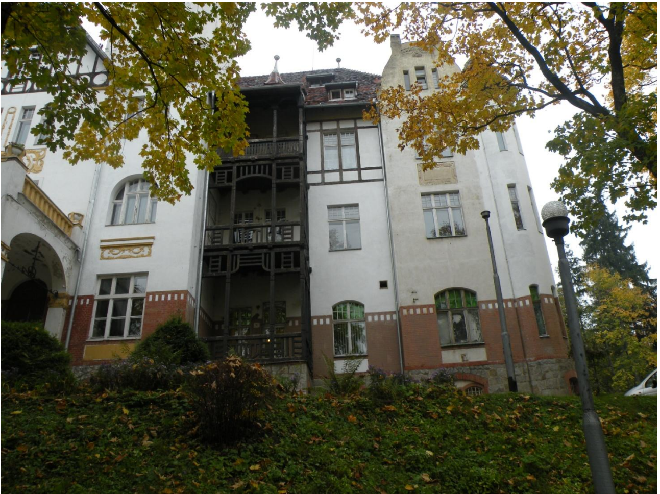
Fot. Nr 7 Fragment elewacji północno-wschodniej