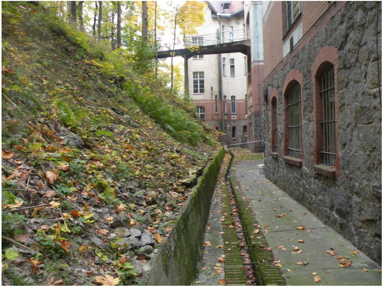
Fot. Nr 5 Fragment cokołów i elewacji od strony skarpy -zachodnia