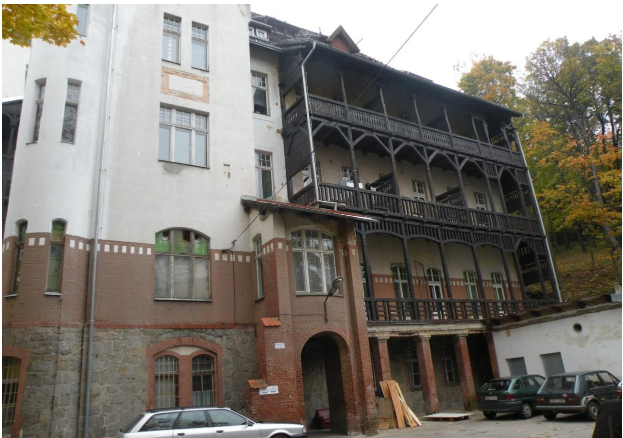
Fot. Nr 6 Fragment elewacji od strony północnej