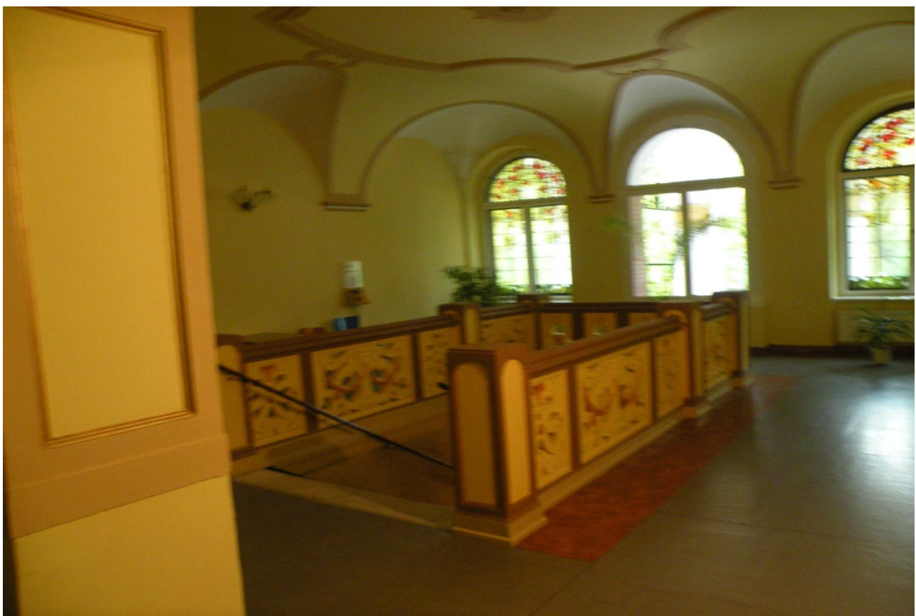
Fot. Nr 10 Fragment hollu wejściowego na poziomie wysokiego parteru