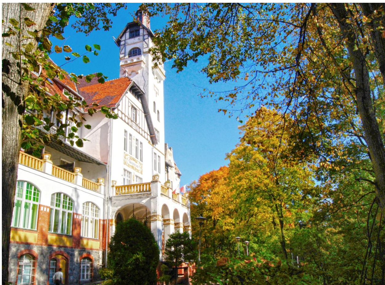
Fot. Nr 2 Fragment elewacji i wejścia frontowego