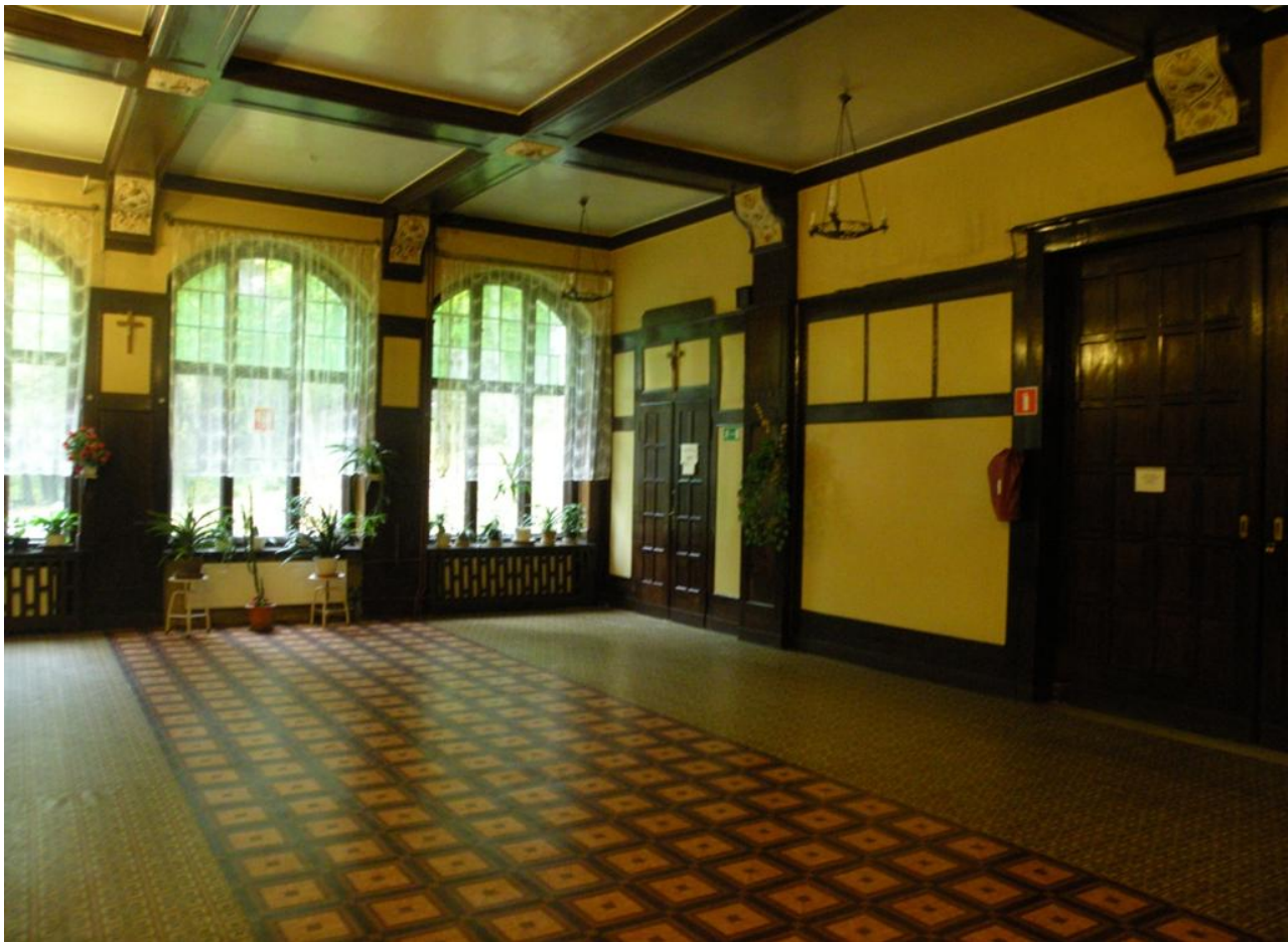
Fot. Nr 9 Widok sali na poziomie wysokiego parteru